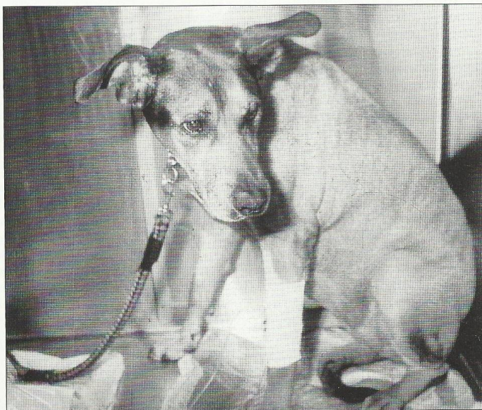
Προβληπτικοί για το μέλλον του.

Μέσα σ’ αυτόν τον ευτελισμό της ζωής, τι περιθώρια δράσης έχουμε; Και λεω δράσης και όχι αντίδρασης, γιατί αντίδραση στη ζωή και παρανομία στους φυσικούς νόμους είναι η ευτέλεια, αντίδραση είναι η περιφρόνηση στη ζωή, η εξόντωση όλων των ειδικών της Ελληνικής πανίδας για κόμπι των